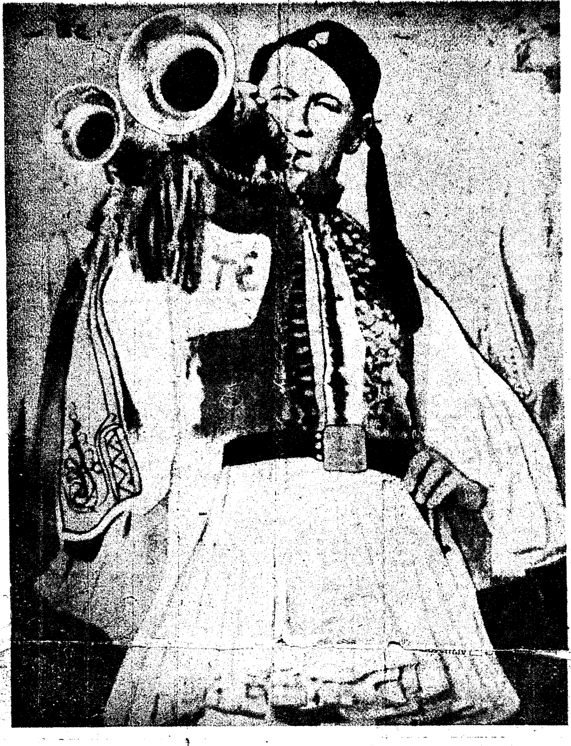
«...καὶ σὰν πρῶτα ἀντρειωμένη χαίρε ὧ χαίρε λευτεριά !...»

χία που μας έπεσώρρευσεν ό πόλεμος και ή κατοχή, να διαφθείρουν τα ήρωτκά παιδιά μας καί νὰ τοὺς βάλουν στὸ χέρι τὸ ὅπλο ποὺ τὸ στρέφουν στην φτωχή μάννα τους. Μὲ τὸν τρόπον αύτον και με την προσωπίδα του Ελληνος στά μουντζουρωμένα άπό την άτιμωση μούτρα τους μας ἄνοιξαν μεγάλη πληγή ὄχι δμως άγιάτρευτη. Και πάλιν τὰ Ἑλληνικὰ ὅπλα θὰ τιμηθούν με νέες δάφνες, και πάλιν τὰ Ἑλληνικά στήθη θά γεμίσουν μὲ παράσημα δόξης.