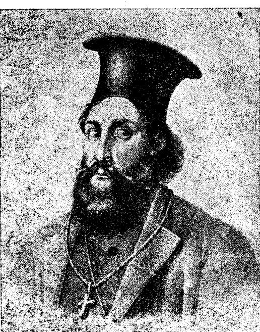
΄Ο Π. Π. Γερμανός ἀπό ίστορική φωτογραφία

Είδικῶς γραφέν διὰ τὴν «'Αγροτικὴν 'Ανόρθωσιν»