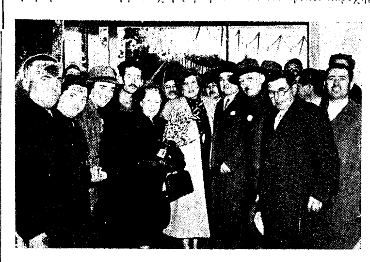
°Η κ. Γκρέηντυ και οι ἐπίσημοι είς τὰ Τσουκαλέικα

΄ Άργανωμένος καὶ σύσσωμος θέλησιν των άγροτων αύτων διὰ Γγωγικών ἔργων των είναι τό κύ-