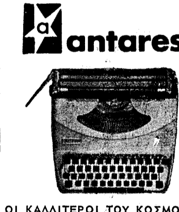
ΟΙ ΚΑΛΙΤΕΡΟΙ ΤΟΥ ΚΟΣΜΟΥ